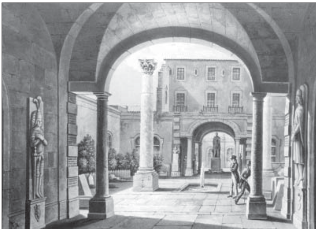
A sx: Fig. 5 - Veduta del primo dei due cortili del Museo Biscari in una litografia del 1826 (dis. di Vanzelle da uno schizzo del conte di Forbin, incisione di Sutherland, da J. F. d'Osterwald, Voyage pittoresque en Sicile, II, Paris 1826, ora Viaggio pittorico in Sicilia, a c. di S. Di Matteo, Palermo 1987, p. 297; anche F. BASILE-E. MAGNANO DI SAN LIO, Orti e Giardini dell'aristocrazia catanese, Messina 1996, fig. 2). In basso: Fig. 6 - Ritratto del Principe di Biscari, sullo sfondo l'acquedotto di Ragona (da D. SESTINI, Descrizione... )

del museo, di varie parti interne della casa, per l'allestimento di un teatro aperto al pubblico, servendosi dell'opera dell'architetto Francesco Battaglia. Ma egli stesso progettò un grandioso ponte-acquedotto, che dal 1765 fece costruire nel suo feudo di Ragona (fig. 6) per bonificare una parte della valle del Simeto e portare l'acqua in città (25) , meritandosi fama di grande architetto nella cultura contemporanea (26) , e le opere di costruzione del porto di Catania (27) .