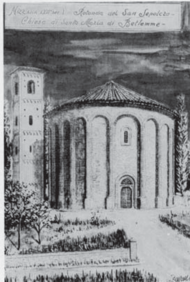
A lato: Chiesa di Mizzana (FE). Ricostruzione di Carlo Zavarini.

Inoltre essi, avendo la medesima origine, spessissimo operavano in contatto con i monaci cistercensi. Non si può