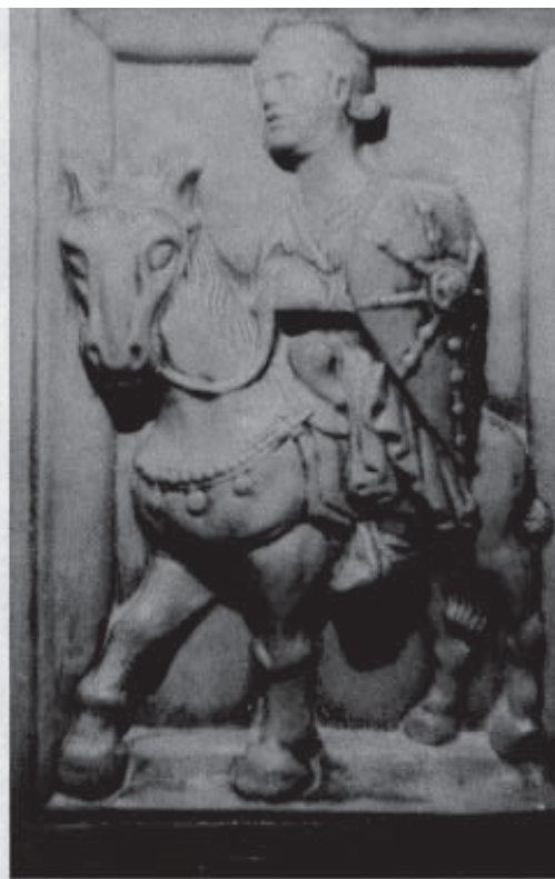
Guglielmo III degli Adelardi, sec. XII.

- d) fu costruita od ampliata, forse per corredarla ulteriormente del monastero e dell'ospizio, da Guglielmo II che in Terrasanta ebbe modo di apprezzare i Cavalieri rossocrociati e che, oltre ad essere rappresentato in tenuta da crociato in una statua posta presso la porta dei Mesi in una fiancata del Duomo di Ferrara (48) , lo è anche nella formella del mese di maggio e in una statua equestre armato di tutto punto. Sul suo scudo è