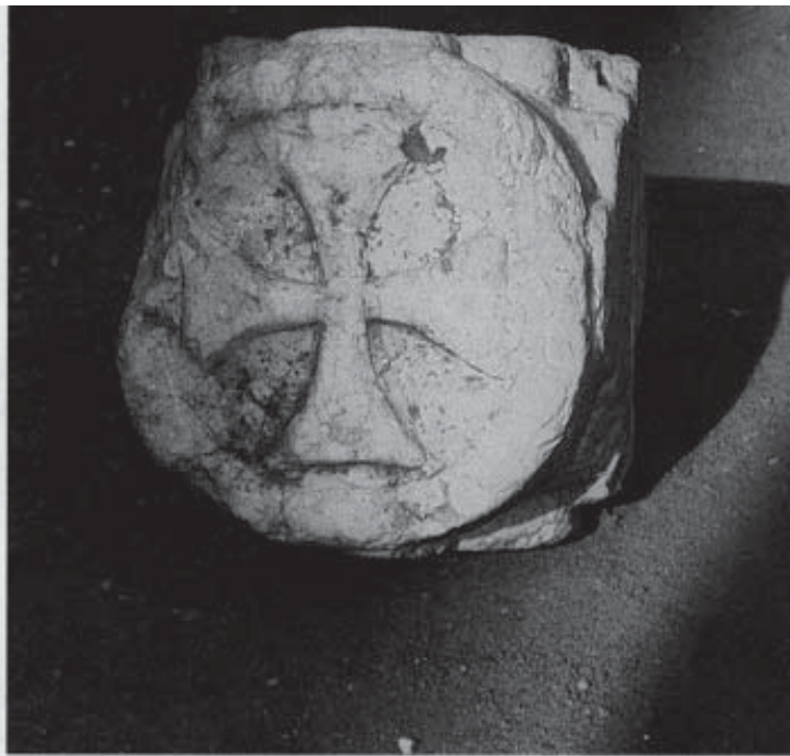
C r o c c e Templare rin- venuta presso la Chiesa di M i z z a n a (Ferrara).

Continuai quindi le mie ricerche, però non approdai a nulla di concreto. Pubblicai due articoli che riportavano queste mie ipotesi (28) e mi rivolsi verso altri interessi. Ma fu due anni più tardi, quando, nel corso delle ricerche per la stesura di un articolo sui Cavalieri di Malta a Ferrara (dove tennero il Gran Magistero dal 1826 al 1834) (29) , i Templari uscirono dai più riposti meandri della storia con un'inaspettata e