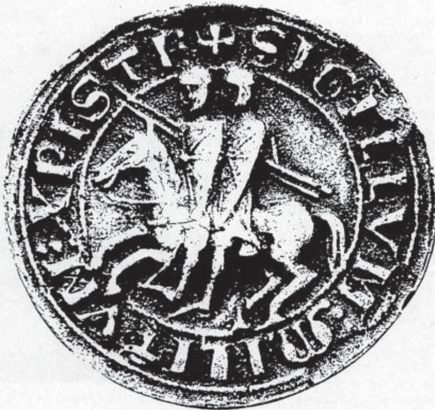
Sigillo Templare, sec. XIII.

col titolo: l'Area medievale degli ospedali per pellegrini a Ferrara (templare, crocigero e di S. Frediano) (51) .